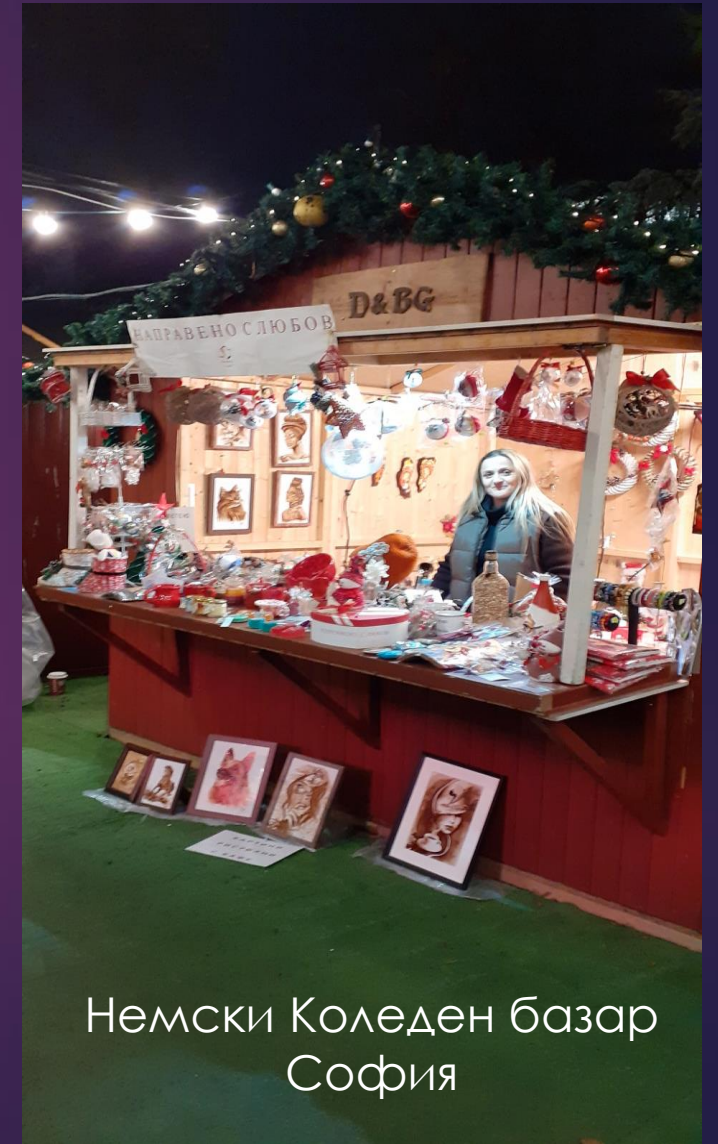
Немски Коледен базар София

Участвахме в 4 /четири/ различни базара, за да популяризираме творчеството на хората с увреждания и да съберем средства за нашите инициативи. Базарите ни предоставят възможност да представим уникалните ръчно изработени сувенири и артикули, създадени от нашите таланти творци. Чрез нашето участие в тези събития повишаваме осведомеността за уменията и талантите на хората с увреждания; създаваме връзки с потенциални клиенти и партньори; генерираме средства, които подкрепят нашите проекти и инициативи.