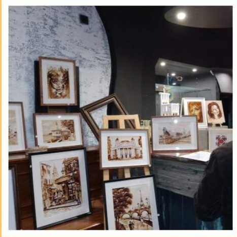
Изложба "През моите очи"

Благодаря за всичко! Това беше моя детска мечта- да участвам на изложба с моите икони!